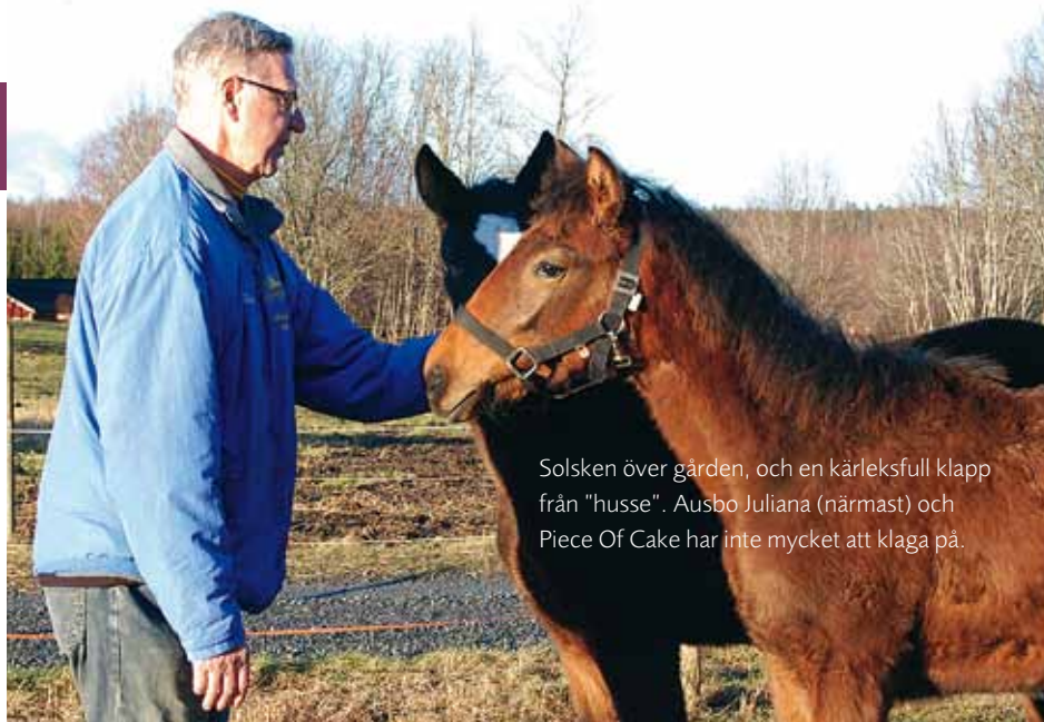
Solsken över gården, och en kärleksfull klapp från "husse". Ausbo Juliana (närmast) och Piece Of Cake har inte mycket att klaga på.

första slurken mjölk av sin mamma, då först brukar jag lämna stallen.